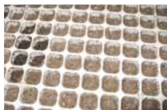
▲ プラグトレーの凹加工