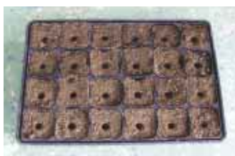
▲ ポリポットの移植穴加工